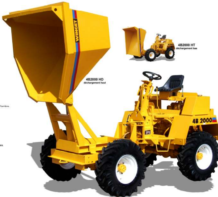
4B2000 HD déchargement haut