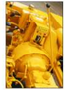
مستلوق تروس جديد للخدمة الشاقة